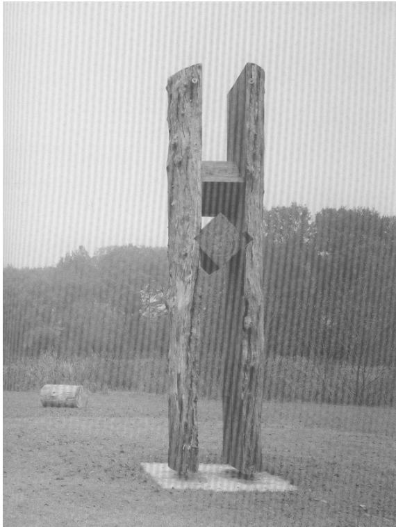
„Stammschnitt II“ Karl-Heinz Heming Holzskulptur, 4,40 m hoch