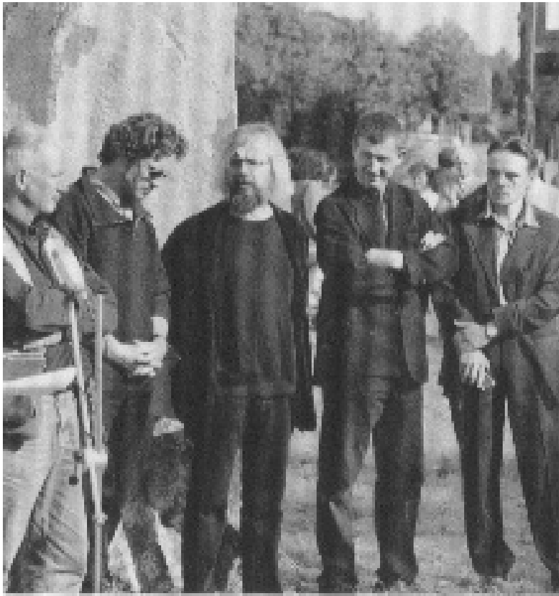
Teilnehmer des 2. Bildhauersymposiums

Der Plan des VVV-Hinsbeck, im Rhythmus von 5 Jahren ein Bildhauersymposium in Hinsbeck zu veranstalten, konnte im Jahre 1997 trotz vieler Probleme im Vorfeld realisiert