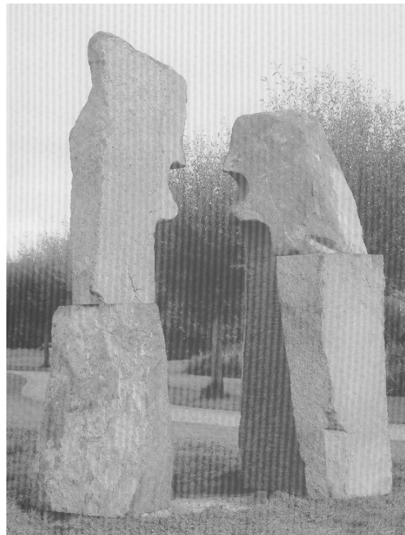
„Der ausgesparte Mensch“ Peter Rübsam Basaltlava, Höhe 3,0 m